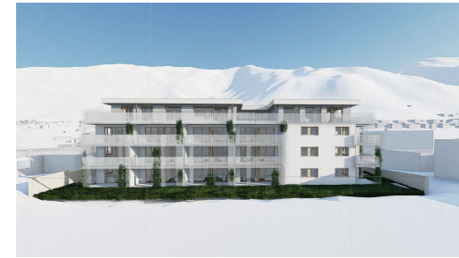
WA STEINA - Steinach am Brenner