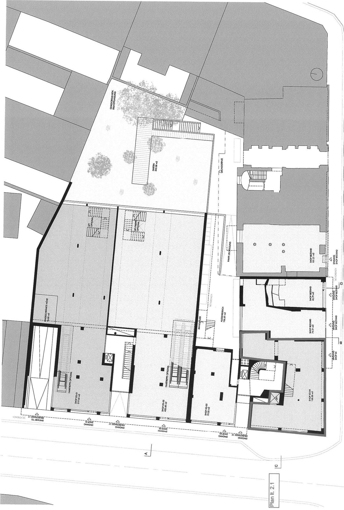
Plan lt. 2.1

ERLERSTRASSE 17&19, MERANERSTRASSE 7&9 MÄRZ 2011