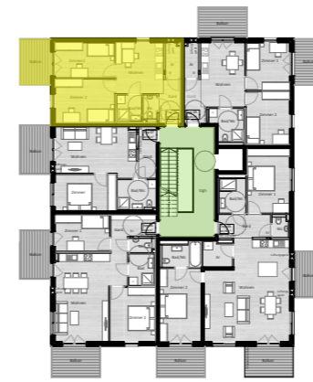
Übersicht 1. Obergeschoss