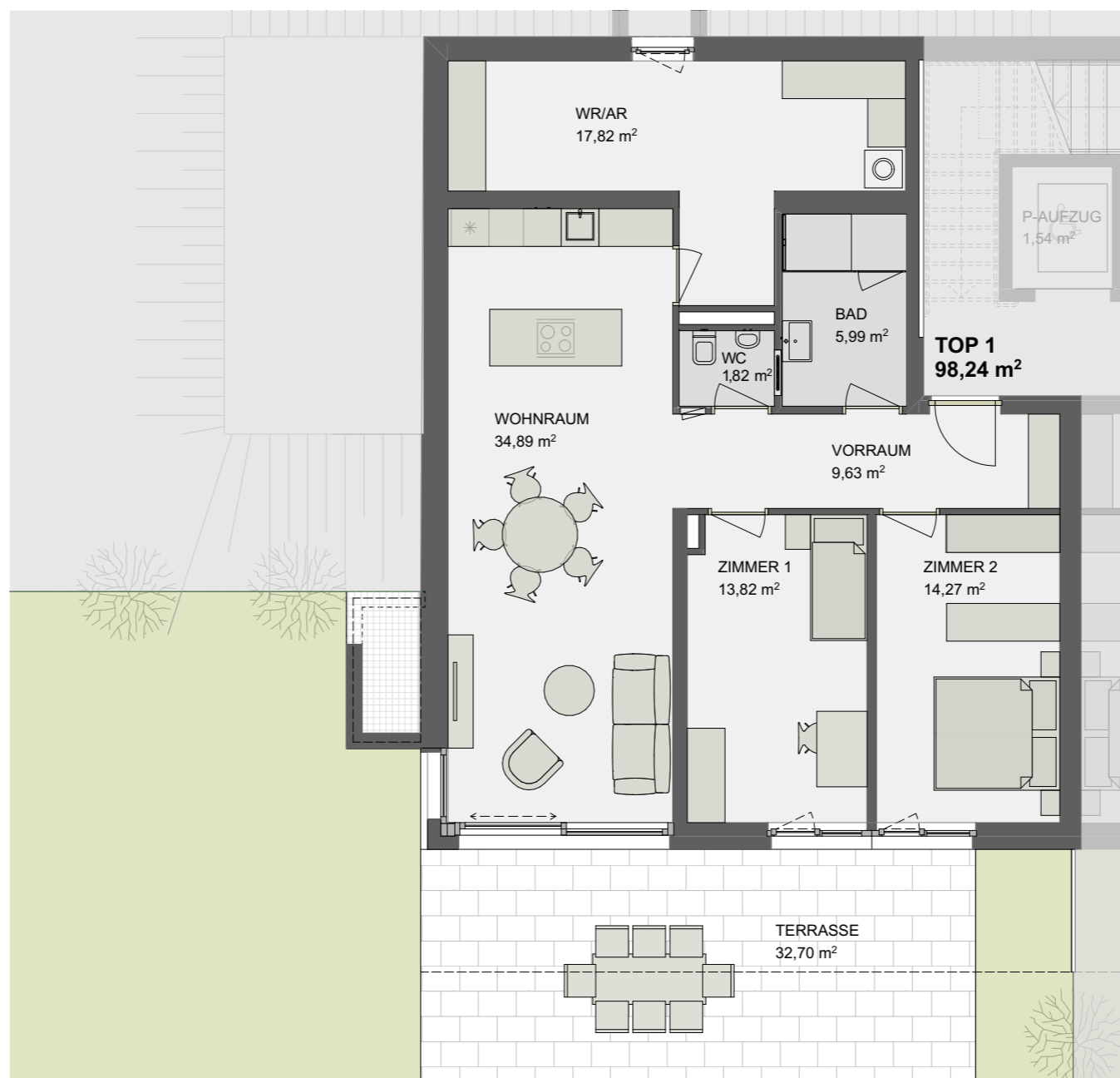
GARTEN TOP 1 F: 258,37 m 2