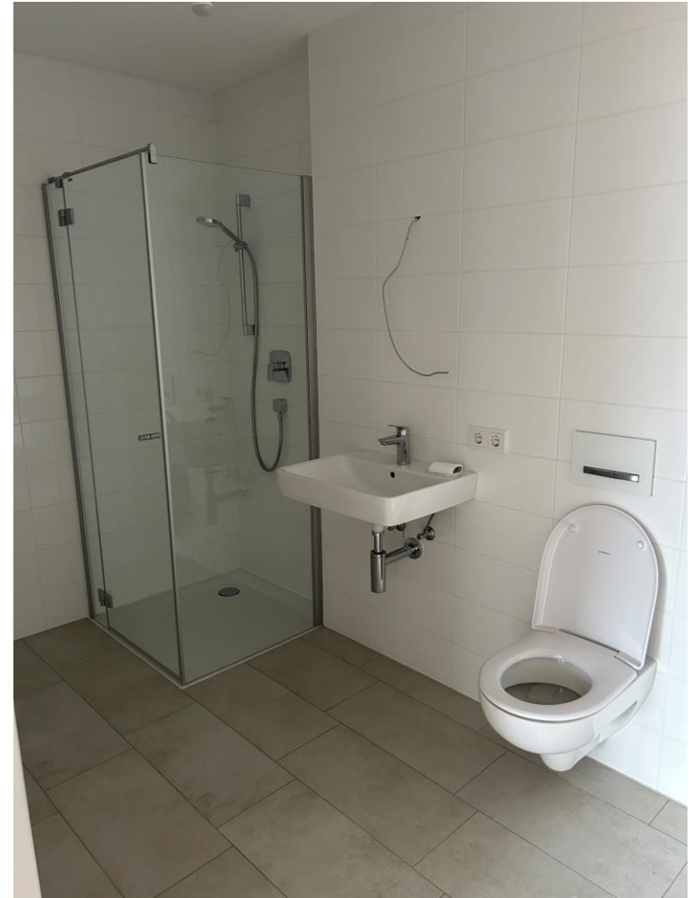
Bad / WC