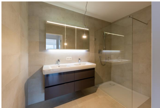
BAD / WC