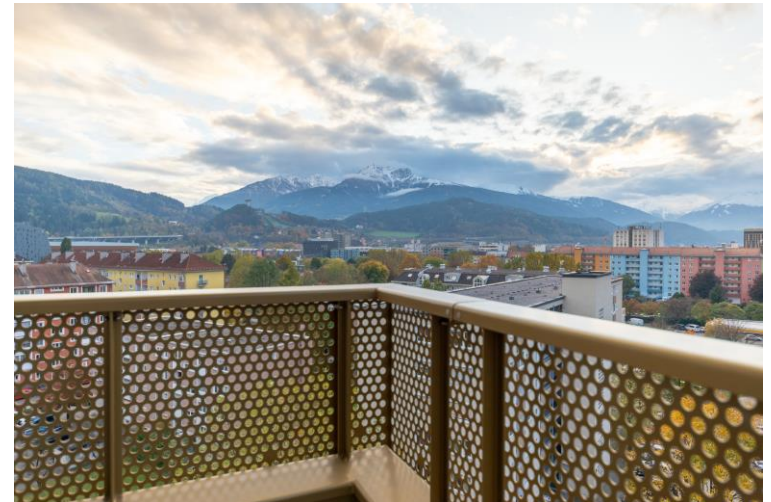
Balkon / Aussicht