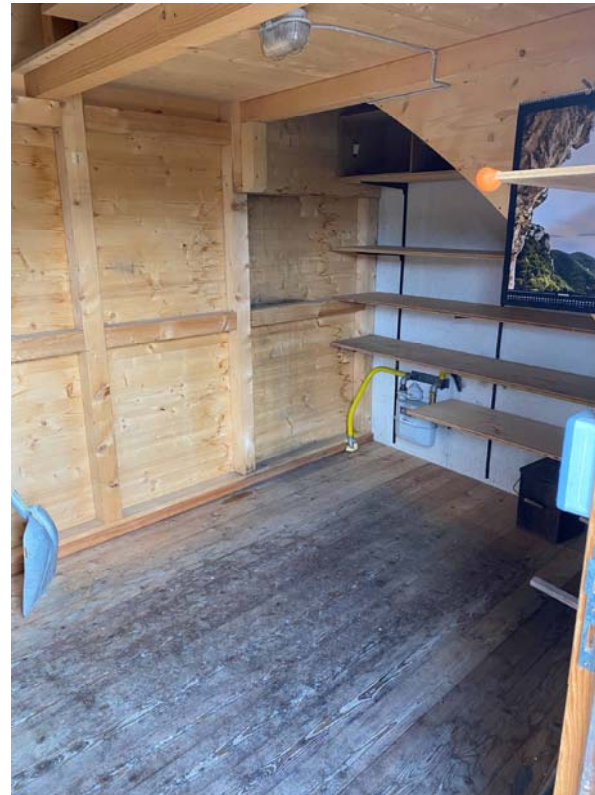
Lagerraum im EG