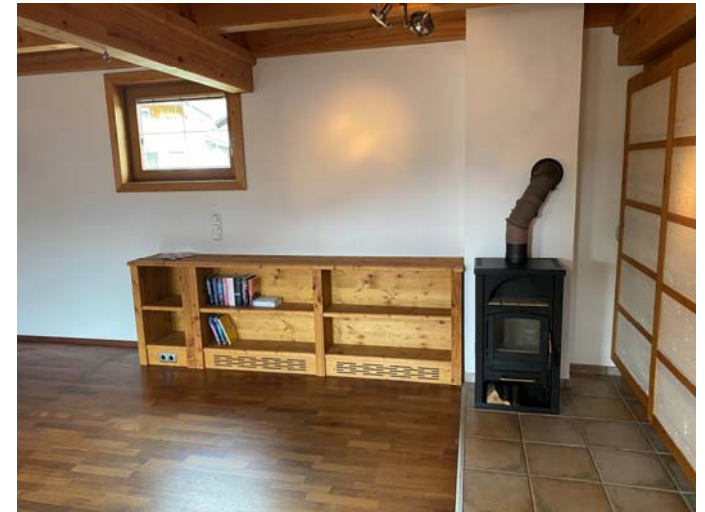
Wohnzimmer mit Ofen