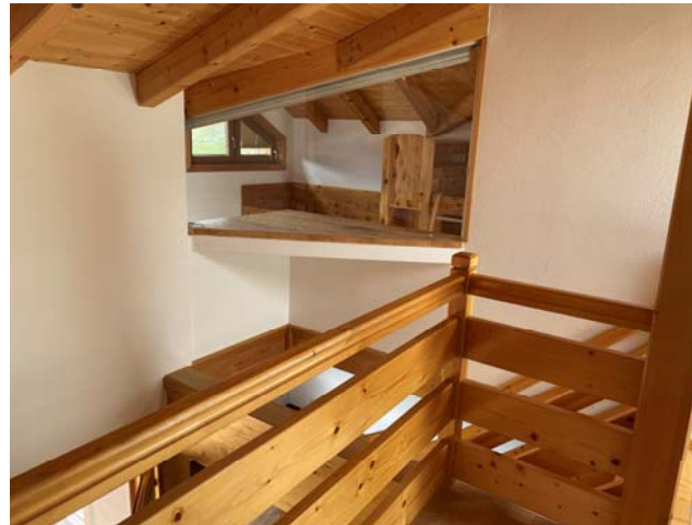
Blick ins Kinderzimmer (Trennglas)