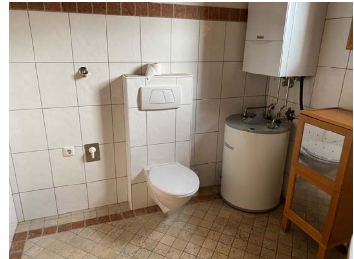
WC mit Gasterme und Boiler