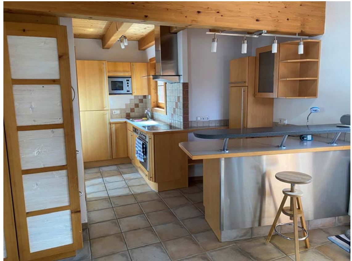
Küche mit Bar