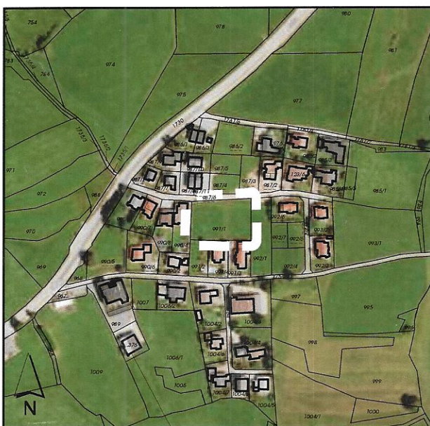
ÜBERSICHTSPLAN Maßstab: 1:5.000 DETAILPLAN: Maßstab: 1:500