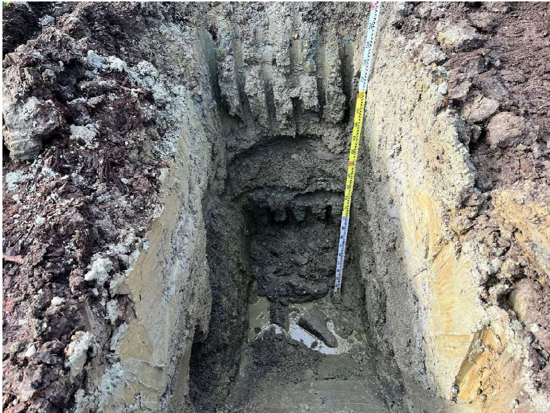
Abbildung 2: Situation im Schurf SCH 3. Im Kies tritt eine starke Grundwasserführung auf. Der oberhalb des Kieses anstehende Schluff ist weich und nass, deshalb sind die Böschungen instabil.

Das Moränenmaterial steht in einer Tiefe von 2,50 m unter der Geländeoberkante bzw. auf einem Absolutniveau von 680,84 m ü. A. (SCH 5) an. Die Moräne zeigt eine aufgeschlossene Dicke von 0,40 m und reicht bis in eine Tiefe von 2,90 m unter der Geländeoberkante bzw. auf ein Absolutniveau von 680,44 m ü. A. Die Unterkante der Moräne konnte am Endpunkt des Baggerschurfes SCH 5 in einer Tiefe von 2,90 m unter der Geländeoberkante nicht erreicht werden.