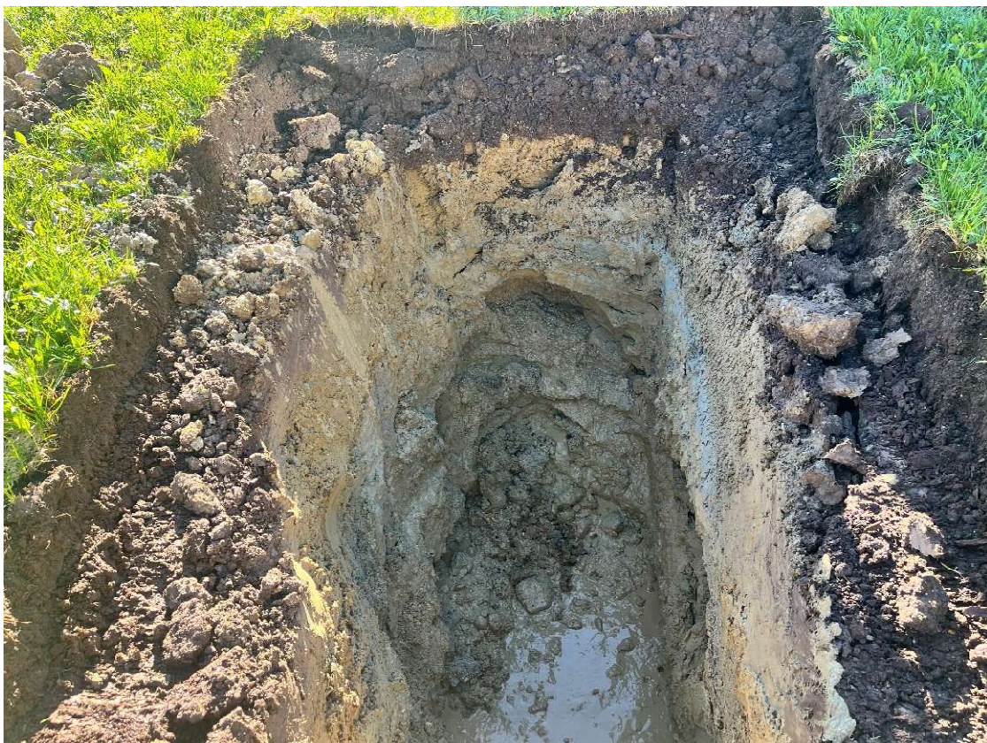
Abbildung 1: Situation im Schurf SCH 1. In der Schluffschicht die unter dem Humus ansteht tritt eine starke Schichtwasserführung auf. Die Schurfwände sind deshalb instabil. Der Kies der an der Schurfsohle zu erkennen ist wassergesättigt.

Der Kies ist wassergesättigt bzw. stark Wasser führend, deshalb mussten die Grabungsarbeiten zur Herstellung der Schürfe aufgrund der dadurch hervorgerufenen Instabilität der Grubenwände in Tiefen zwischen 3,10 m (SCH 1) und 2,60 m (SCH 2 und SCH 4) unter der Geländeoberkante abgebrochen werden.