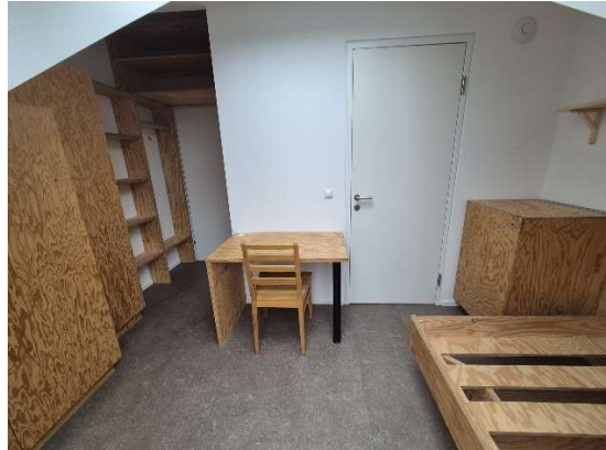
Zimmerbeispiel im DG mit Dachschräge