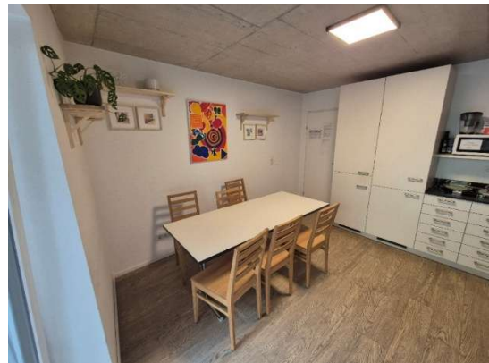
Gemeinschaftsküche mit Essbereich