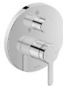
Einhebel-Brausemischer Fa. Duravit