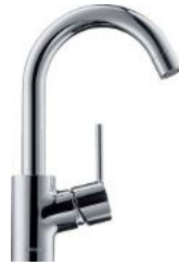
Einhebelwaschtischmischer Fa. Hansgrohe