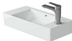
Handwaschbecken 450 x 250mm Fa. Duravit