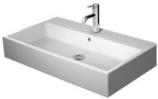
Waschtisch 800 x 470mm Fa. Duravit