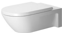
Flach- und Tiefspüler Fa. Duravit